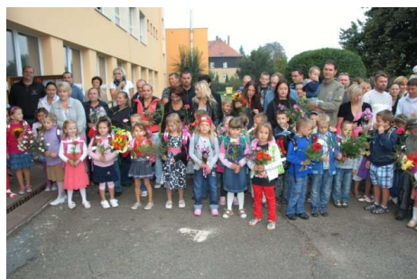
Foto ze zahájení nového školního roku 2012/2013