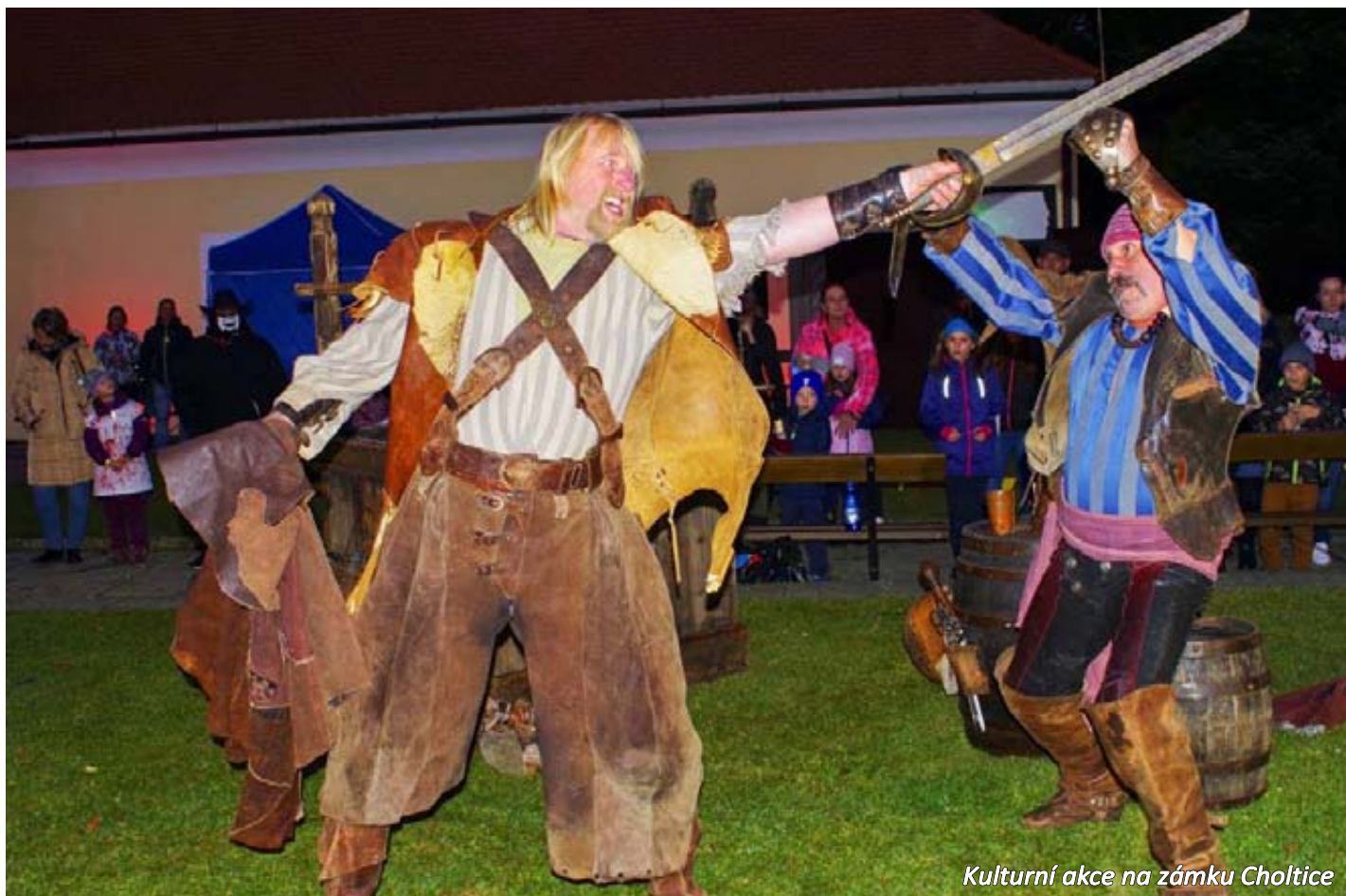
Kulturní akce na zámku Choltice