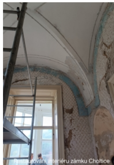
Restaurování interiéru zámku Choltice