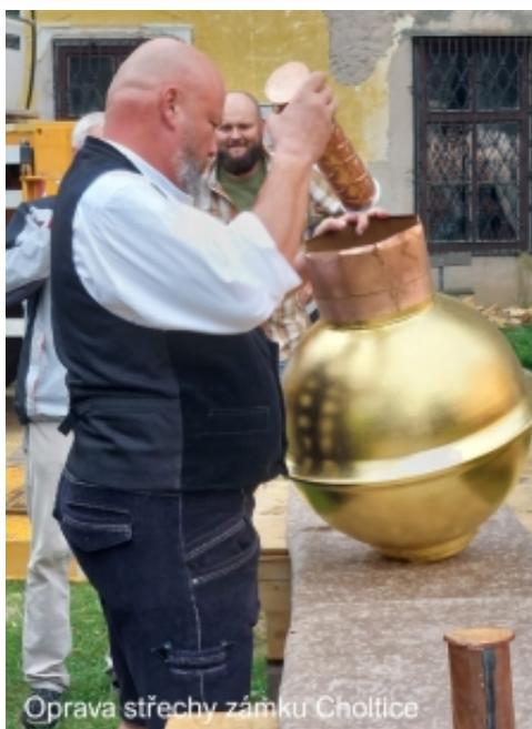
Oprava střechy zámku Choltice