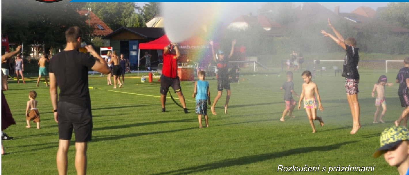
Rozloučení s prázdninami