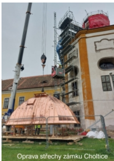
Oprava střechy zámku Choltice